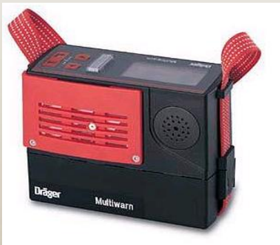
Multigasdetector O 2 , CO, CH 4 , SO 2