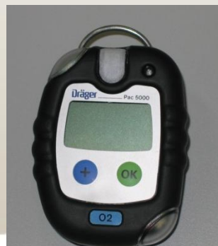
O 2 - detector