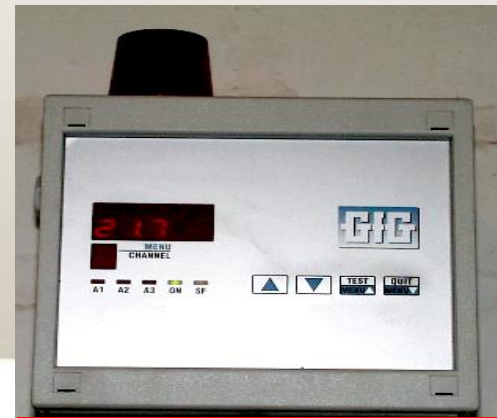
Vaste O 2 -meter