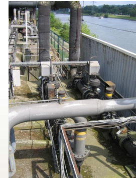
Poste à gaz